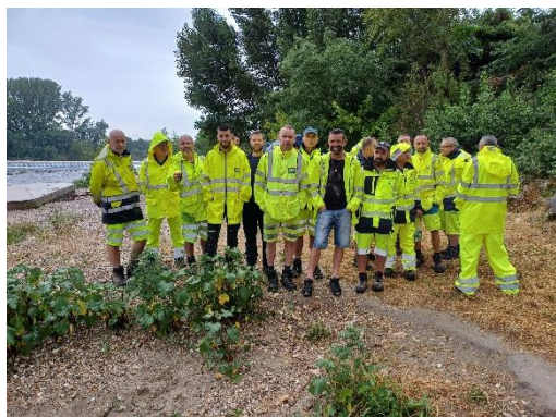
Les groupes de Thoiras et de Remoulins.